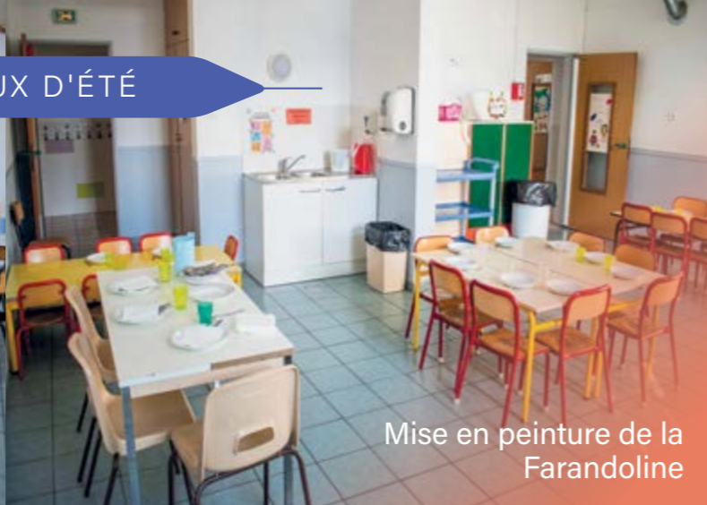
Mise en peinture de la Farandoline