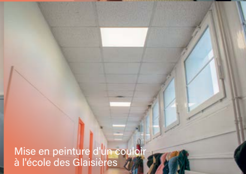
Mise en peinture d'un couloir à l'école des Glaisières