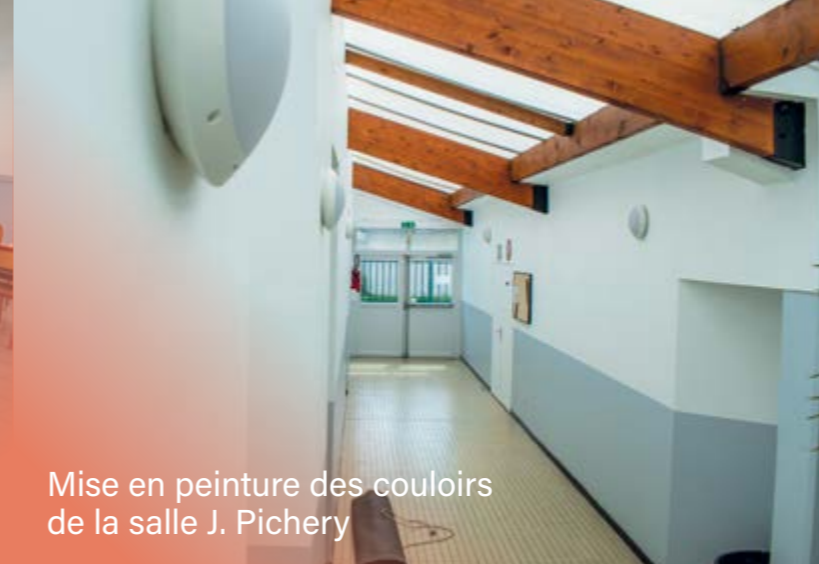
Mise en peinture des couloirs de la salle J. Pichery