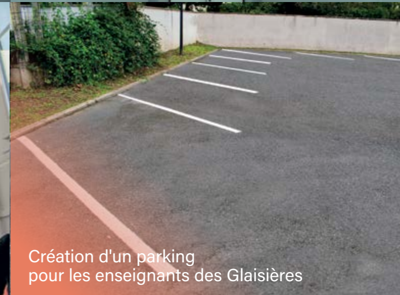
Création d'un parking pour les enseignants des Glaisières