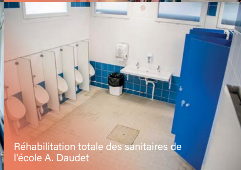
Réhabilitation totale des sanitaires de l'école A. Daudet